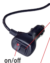
Commutateur de sélection de motif/couleur

- Appuyez sur le commutateur de sélection pendant moins d'une seconde pour passer au motif clignotant suivant.