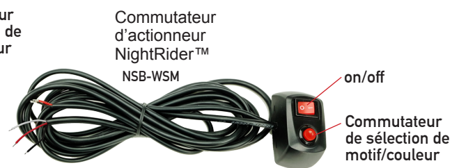
Commutateur d'actionneur NightRider™ NSB-WSM

- Appuyez sur le commutateur de sélection pendant 3 à 5 secondes pour changer de couleur, appuyez à nouveau pendant 3 à 5 secondes pour alterner les couleurs, appuyez à nouveau pendant 3 à 5 secondes pour la couleur initiale.